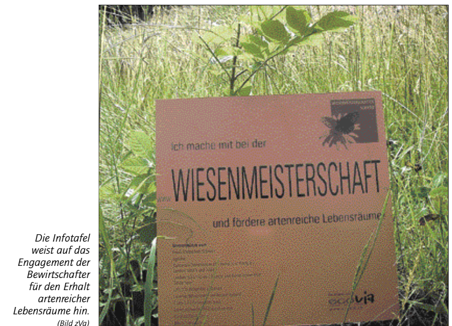
Die Infotafel weist auf das Engagement der Bewirtschafter für den Erhalt artenreicher Lebensräume hin.

Die definitive Auswahl der Sieger wird durch eine unabhängige Jury entschieden – mit Vertreterinnen und Vertretern des Kantons, des Landwirtschaftlichen Bildungs- und Beratungszentrums Schöpfheim, des Luzerner Bäuerinnen- und Bauernverbands (LBV), der Unesco-Biosphäre Entlebuch und als künstlerischer Beitrag durch den international bekannten, aus Wolhusen stammenden Künstler Wetz. Mit Hilfe der Beurteilungsbögen und vor Ort aufgenommener Fotos wird die Jury die «Wiesenkönigin» nach ökologischen, landwirtschaftlichen, landschaftsgestaltenden sowie künstlerisch und ästhetischen Gesichtspunkten küren. Die